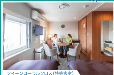
クイーンコーラルクロス(特等客室)