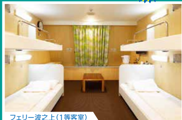
フェリー波之上(1等客室)