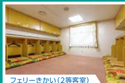
フェリーきかい(2等客室)